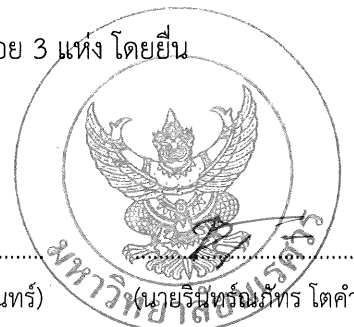
(นายรัฐมนตรีมนตรี โดคำ)