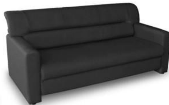
รายการที่ 19