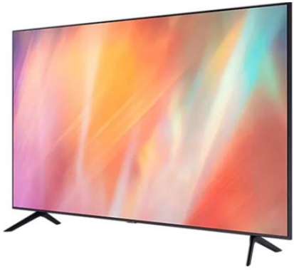
รายการที่ 4