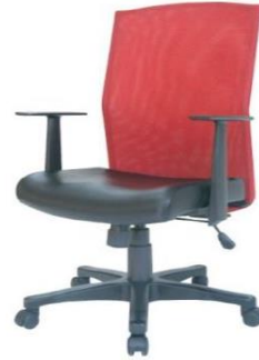
รายการที่ 15