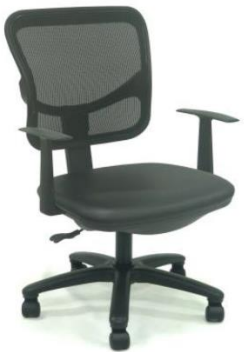
รายการที่ 17