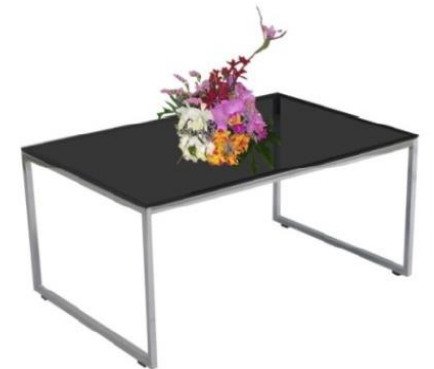
รายการที่ 20