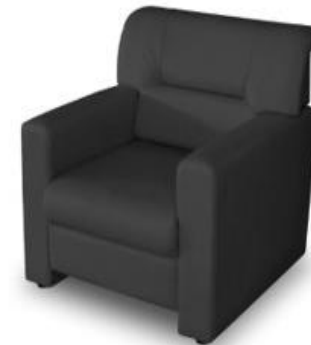
รายการที่ 18