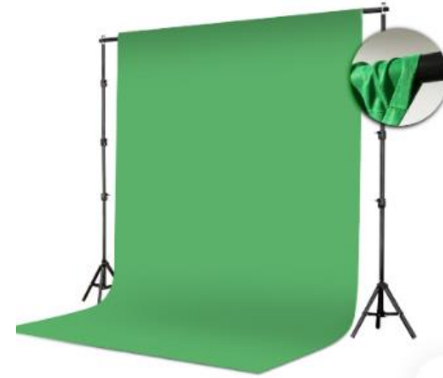
รายการที่ 21