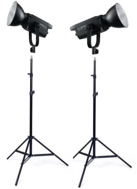
รายการที่ 5