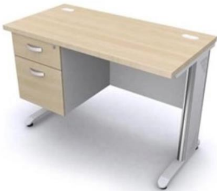
รายการที่ 16